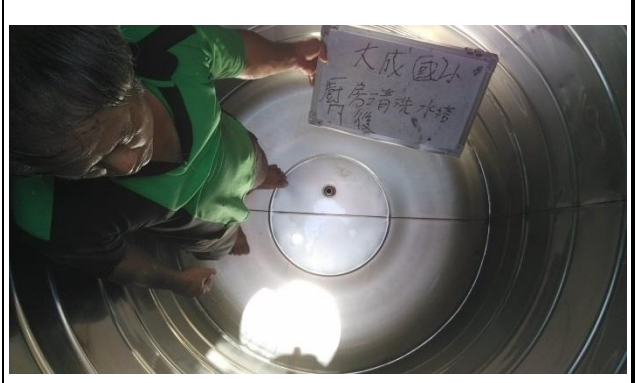
▲照片說明：廚房水塔清洗紀錄 107.07