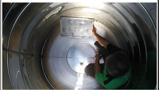
▲照片說明：廚房水塔清洗紀錄 107.07