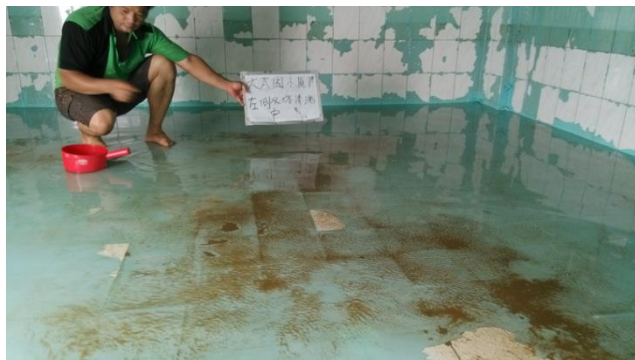
▲照片說明：頂樓左側水塔-清洗中 107.07