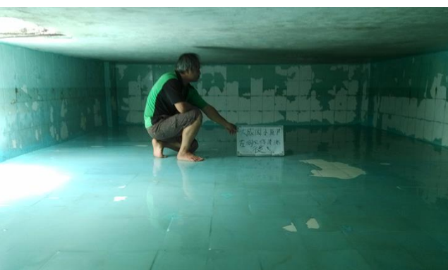
▲照片說明：頂樓左側水塔-清洗後 107.07