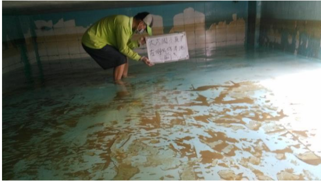
▲照片說明：頂樓左側水塔-清洗前 107.07